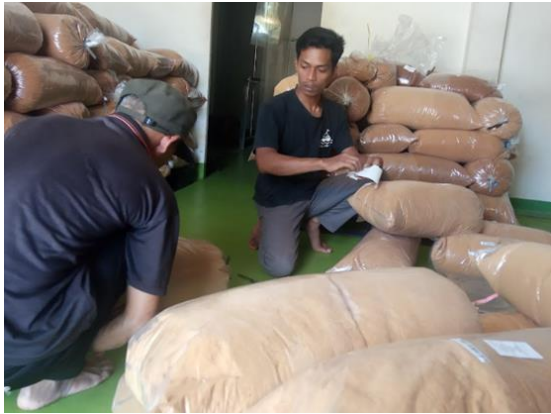
Gambar 2 Pemberian Barcode

Berdasarkan Gambar 2 dapat diketahui pemberian barcode untuk mempermudah pelacakan produk jika diperlukan. Masing masing produk yang masuk ke koperasi memiliki barcode yang berbeda. Pembuatan barcode dilakukan oleh pegawai koperasi setelah produk ditimbang dan dicatat. Produk yang telah mendapatkan barcode akan dimasukkan ke gudang.