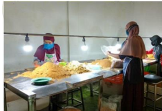
(Proses Penyortiran) Gambar 3 Proses Penyortiran

Berdasarkan gambar 3 dapat diketahui gambaran tempat dan proses sortir gula semut. Tujuan adanya tahap sortir adalah untuk memastikan dalam produk gula semut tidak tercampur benda benda kecil. Sumber dari benda kecil contohnya serpihan kecil kayu bakar. Satu kali tahap sortir menampung 50 kg. Gula sebelum penyortiran, melalui pencatatan, guna pencatatan untuk mengantisipasi adanya pencampuran komponen. Melalui pencatatan bisa dijadikan sebuah bukti yang akurat. Proses setelah penyortiran adalah pengovenan, satu kali oven memuat 5 ton gula semut. Oven yang digunakan oleh koperasi Nira Kamukten terdapat pada gambar 4.