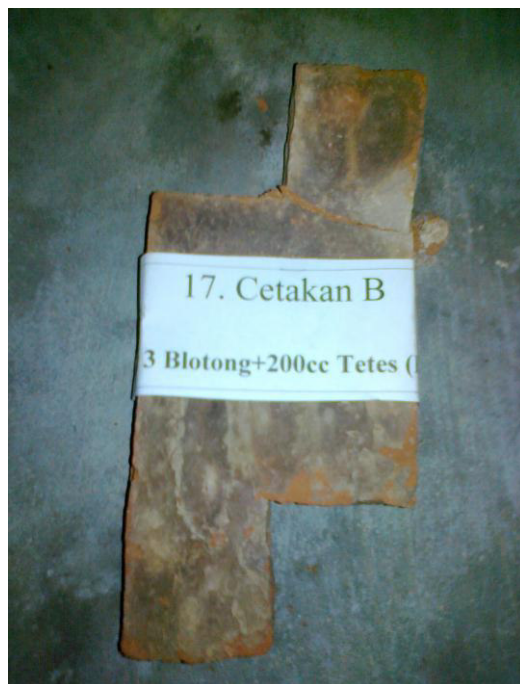
Gambar 3: Batu bata blotong

Pengamatan visual menghasilkan sebagai berikut: