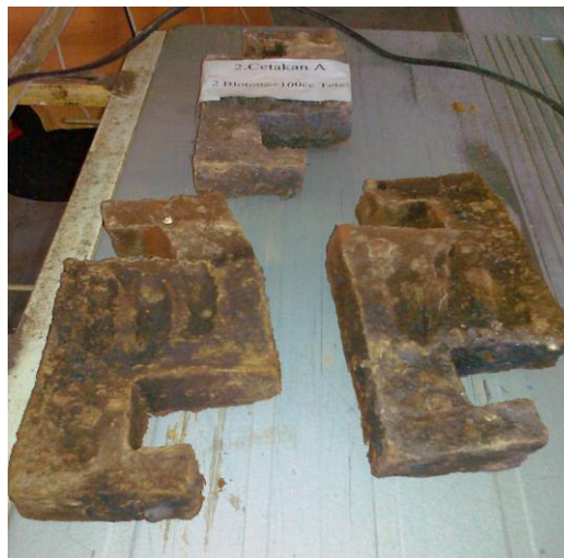
Gambar 3: Batu bata blotong

Pengamatan visual yang peneliti lakukan adalah menekankan pada Warna; penyerapan air; kembang susut.