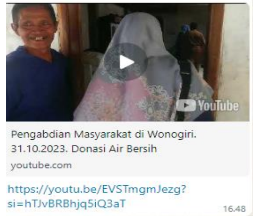
Photo 9. Publikasi di Youtube https://www.youtube.com/watch?v=EVSTmgmJezg

Kegiatan pengabdian ini sudah dilengkapi dengan aturan baku perguruan tinggi, yaitu surat tugas bahwa kegiatan ini resmi dari kampu UNIBA Surakarta. Dilengkapi dengan backdrop pengabdian, hal ini menunjukkan bahwa kegiatan ini direncanakan dan dikelola dengan dengan baik, koordinasi dengan pemangku kepentingan juga berjalan baik. Tidak kalah pentingnya bahwa kegiatan tersebut juga dipublikasikan di youtube sebagai dokumen pengabdian di media internet (Hadi, P.dkk, 2021).