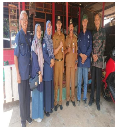
Photo 6. Dukungan aparaturn pemerintah Desa Jatirejo 31-Oktober-2023