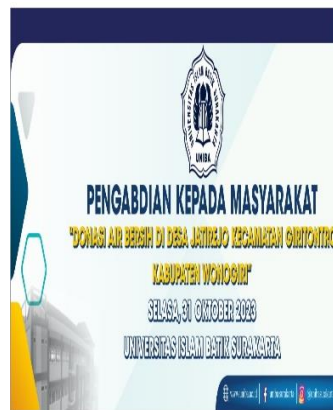
Photo 8. Cover backdrop. Di desa Jatirejo, Wonogiri 31-Oktober-2023