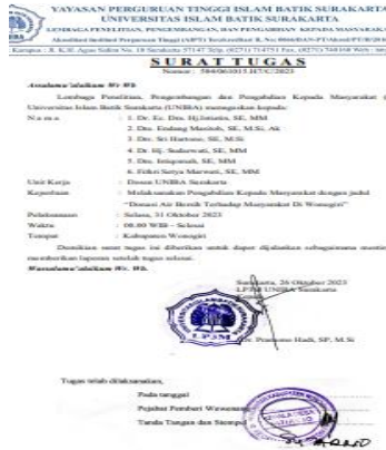
Photo 7. Surat tugas pengabdian di desa Jatirejo, Wonogiri 31-Oktober-2023

pembawa air bersih ke pihak kalurahan, yang selanjutnya akan ditampung ditempat penampungan, yang kemudian akan di salurkan ke semua warga yang membutuhkan dan akan disusul dengan armada-armada berikutnya secara bertahap selama bulan Oktoeber 2023 (Hadi, P dkk, 2022).