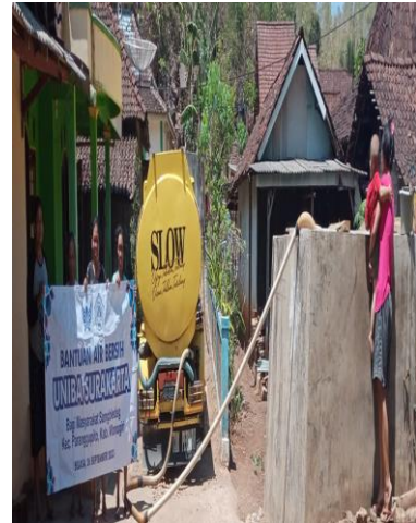
Photo 3. Masyarakat penerima bantuan air bersih 30-September-2023