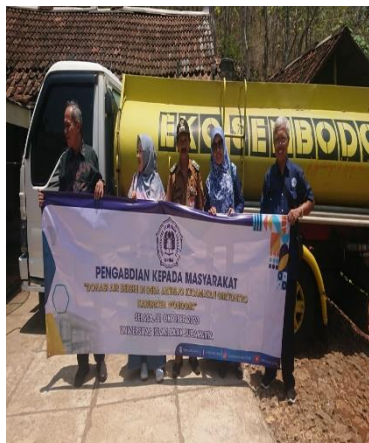
Photo 5. Mobil pembawa air bersih tiba dilokasi 31-Oktober-2023