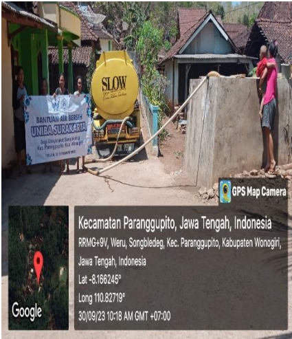
Photo 1. Lokasi bantuan air bersih di Kecamatan Paranggupito, Wonogiri 30-September-2023