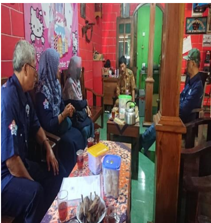
Photo 4. Tim pengabdian diterima oleh Bapak lurah Jatirejo di Kecamatan Giritontro, Wonogiri 31-Oktober-2023

ditempat penampungan lalu didistribusikan kesemua warga yang memerlukan dengan jalur pipa, sehingga tidak ada air yang tercecer. Hal ini sangat efektif dalam pelaksanaan dilapang dan cukup air diterima masyarakat (Rachmawatie, S. J. dkk, 2022).