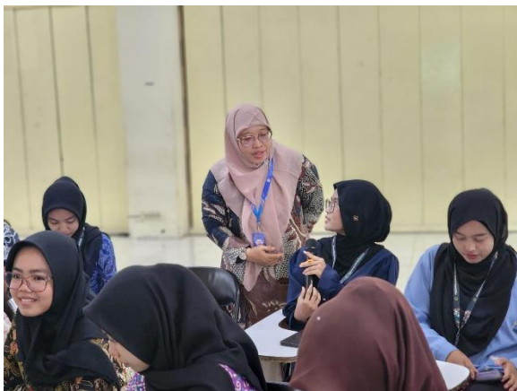
Gambar 3. Antusias Mitra Saat Dialog Interaktif

lulusan akuntan di era digital? Bagaimana menjadi akuntan yang smart di masa digital? Menjadi akuntan harus menjaga integritas, bagaimana para akuntan menghadapi ini? Dan bagaimana sikap kami mahasiswa akuntansi dalam menyiapkan integritas? Banyaknya pertanyaan ini menunjukkan peningkatan rasa tau dan minat mahasiswa mitra menjadi akuntan di era digital.