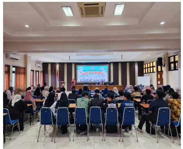
Gambar 1. Kegiatan Workshop Profile Akuntan serta Tantangan dan Peluang Akuntan di Era Digital di Mitra

dengan tujuan untuk mengetahui ptingkat pemahaman dan peminatan mahasiswa mitra.