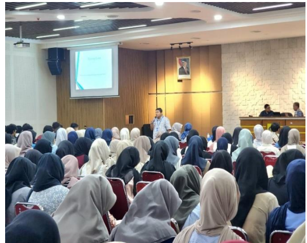
Gambar 2 Sesi Sharing dengan Narasumber dari Praktisi Akuntan

lulus akan melanjutkan menjadi profesional akuntan.