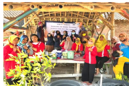
Gambar 8. Kegiatan sosialisasi tanaman Toga bersama Kelompok Wanita Tani (KWT)

Hal ini program KKN berjalan dengan lancar. Dengan secara bersama-sama Kelompok Wanita Tani (KWT) melakukan beberapa program untuk mendapatkan hasil Tanaman Obat Keluarga (TOGA) yang baik seperti, pembersih lahan tanam, pembuatan pupuk cair dan padat, pemupukan lahan tanam, penyemprotan desinfektan dan evaluasi harian.