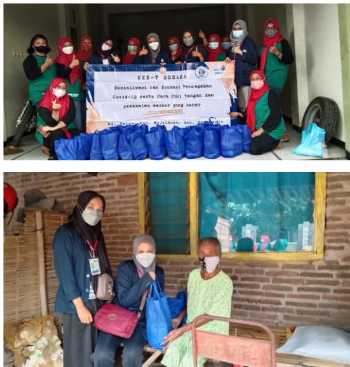
Gambar 11. Pembagian Sembako

Bantuan sosial yang kami salurkan berupa minyak goreng, biskuit, teh, madu, masker, dan hand sanitizer. Bantuan ini kami jadikan satu dengan ibu-ibu PKK desa sapen, dimana hal ini juga akan membantu meringankan beban di saat pandemic covid saat ini (Nurul H et al. , 2020).