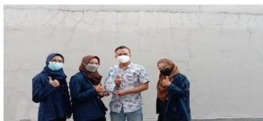
Gambar 4. Acara Sosialisasi gizi daring