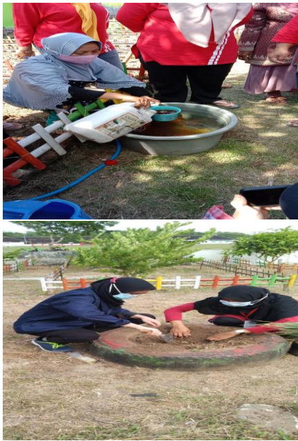
Gambar 9. Menanam Tanaman Toga bersama KWT desa Sapen