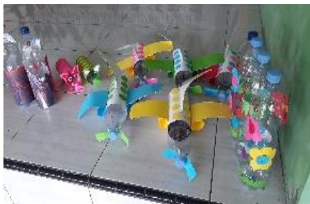
Gambar 7. Membuat celengan dari botol bekas