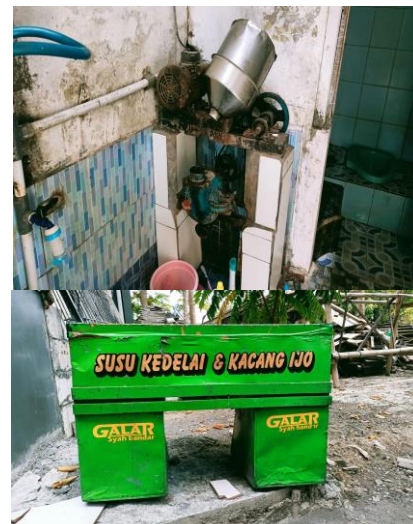
Gambar10. Survei UMKM Susu Kedelai

Program ini dilakukan supaya umkm yang belum dikenal oleh lingkungan sekitar agar dapat mengenali produk susu kedelai ini. Seperti jika ingin pesan mudah sudah tertera nomer handphone ataupun alamat umkm tersebut.