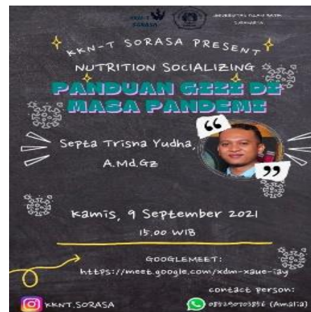
Gambar 3. Desain pamflet undangan sosialisasi gizi daring

Dalam kegiatan ini peserta sangat antusias, dapat dilihat dari adanya tanya jawab antara pemateri dengan peserta yang mengikuti sosialisasi. Kegiatan sosialisasi yang dilakukan ini memberikan efek yang baik terhadap pengetahuan gizi dimasa pandemi bagi masyarakat Desa Sapen.