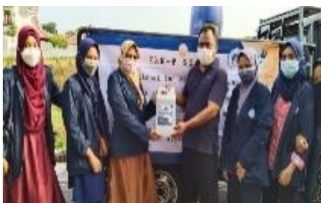
Gambar 5. Kegiatan penyemprotan disinfektan bersama warga