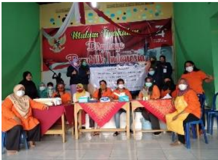
Gambar 1. Kegiatan Sosialisasi Penerapan Protokol Kesehatan