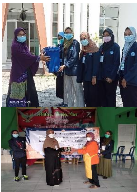
Gambar 2. Penyerahan peralatan cuci tangan, masker, hand sanitizer

Setelah sosialisasi penerapan protokol kesehatan dilakukan kami melakukan evaluasi dimana masyarakat Desa Sapen telah memahami dan bersedia