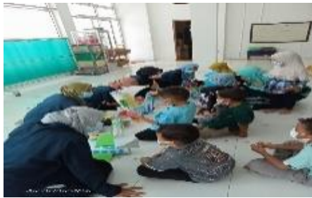
Gambar 6. Pendampingan belajar daring