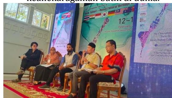
Gambar 9. Diskusi Panel Narasumber Empat Negara (Indonesia, Malaysia, Thailand dan India)