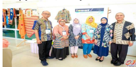
Gambar 1. Stand Workshop Batik Indonesia

Batik dari Indonesia memiliki tiga teknik membatik yaitu : batik tulis, batik cap serta Kombinasi Batik Tulis dan cap (Pamela, 2020).