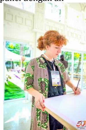
Gambar 2. Peserta Workshop Mahasiswa dari Jerman

Menghilangkan malam batik dengan merebus kain batik ke dalam panci dengan air