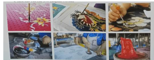
Gambar 4. Teknik Membatik dari Thailand