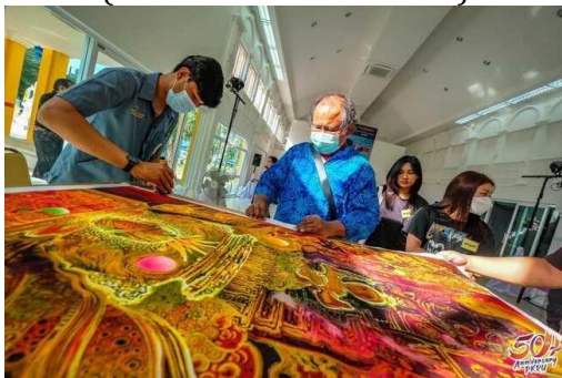
Gambar 6. Stand Workshop Batik Thailand Peserta workshop Thailand