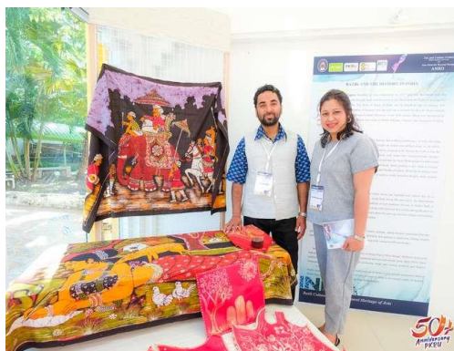
Gambar 7. Stand Workshop Batik India

Batik di India memiliki sejarah yang panjang dan berakar hingga abad ke-1 Masehi. Rabindranath Tagore, setelah mengunjungi Jawa pada tahun 1927, membawa pulang beberapa potongan kain Batik dengan harapan