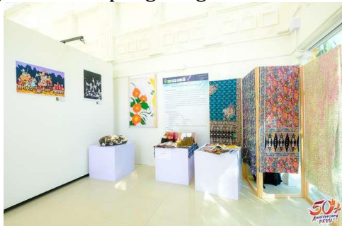
Gambar 3. Stand Workshop Batik Malaysia